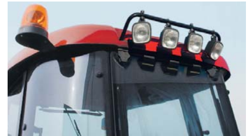
▲ Rundumleuchte und Arbeitsleuchten (Sonderausstattung) sorgen für Sicherheit auf der Straße und beste Sicht auf dem Feld.

Bis die Arbeit erledigt ist. Wenn der Tag sich dem Ende neigt, müssen Sie Ihre Arbeit nicht unterbrechen. Sechs Arbeitsscheinwerfer sorgen auch bei Dunkelheit für ausreichende Beleuchtung Ihres Arbeitsumfeldes.